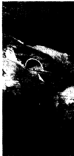
La galleria della Perugia-Ancona

Muccia (Mc), "Polo produttivo agroalimentare"; Fabriano (An) "Incubatore di impresa"; Fabriano (An) "Piastra logistica"; Foligno (Pg) "Servizi alla piastra logistica"; Gualdo Tadino (Pg) "2 aree di sosta".